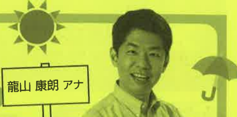
龍山 康朗 アナ

中間市生涯学習センターでこれまで3回「お天気教室」を開き、すっかりおなじみのRKB毎日テレビ・龍山康朗(たつやま やすあき)アナウンサーを招いて「この頃ヘン?お天気よもやま話」を開きます。同アナは防災士でもあり、今回も画像を交えた講演で、わかりやすく気象のメカニズムを解説「その時、どうしたらいいか」など命を守る手だてを語ります。テレビでよく見る名物アナウンサーのナマの特別教室をご家族ぐるみでお楽しみください。